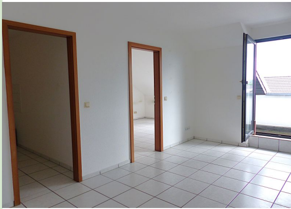
Wohnzimmer, Zugang Küche und Schlafzimmer